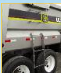
Échelle arrière avec section pliante • accès facile à 20" du sol