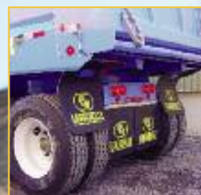
Système de garde-boue rétractables