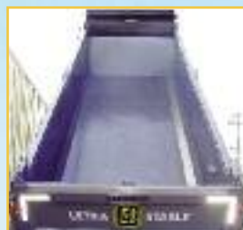
Plancher extra large idéal pour godet à fossé