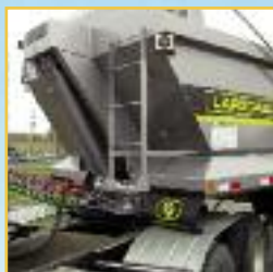
Échelle avant avec première marche surdimensionnée