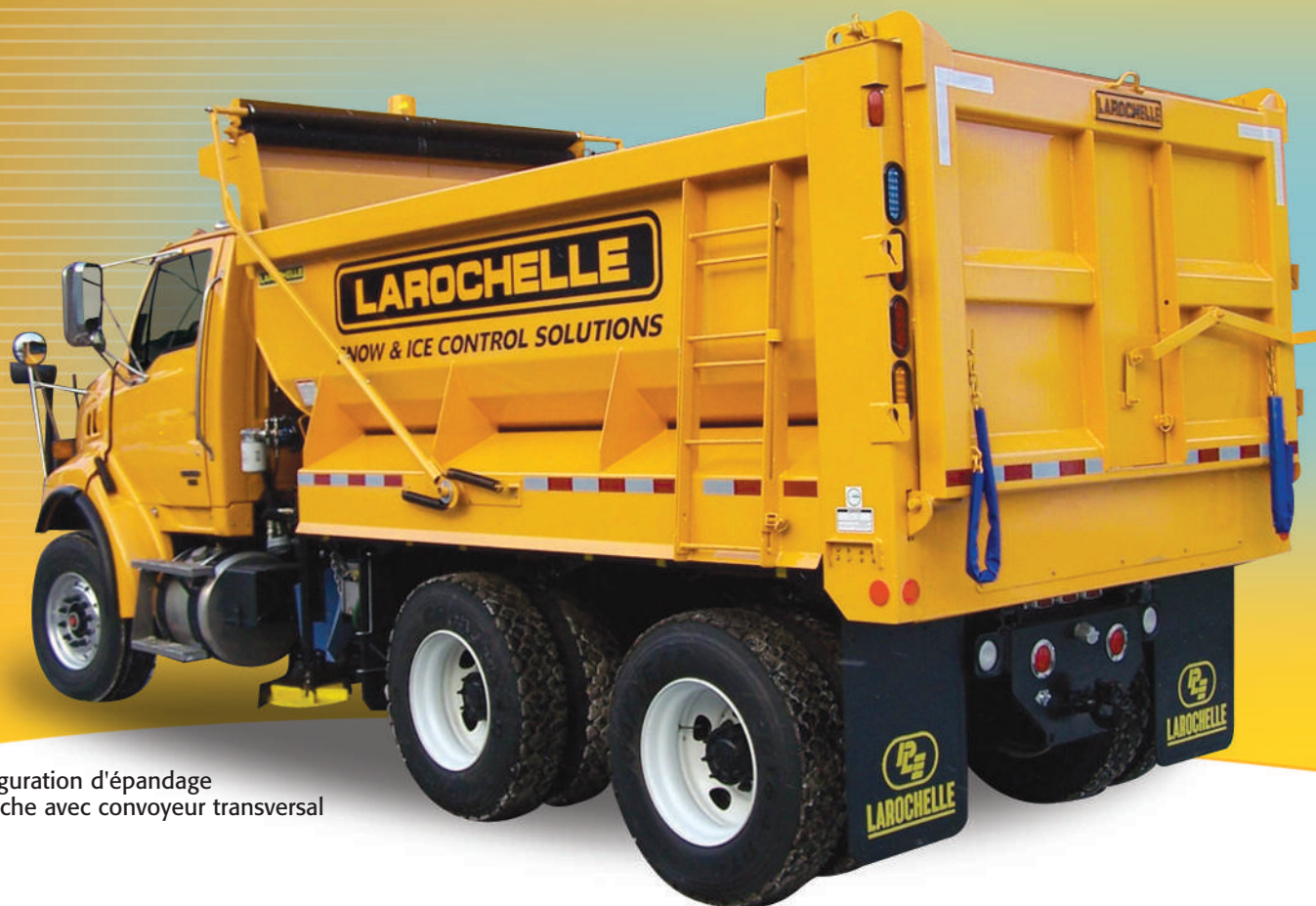
Configuration d'épandage à gauche avec convoyeur transversal